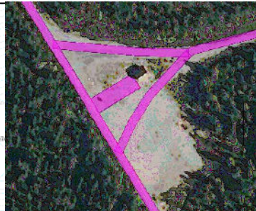
Kuva 1. Esimerkki Nikkarinkaarron kytkemöalueen lumenaurauksesta