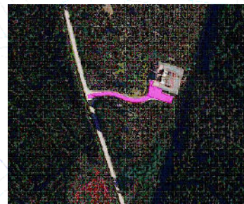
Kuva 3. Esimerkki Nikkarinkaarron sähköasema-alueen lumenaurauksesta

Nikkarinkaarron sähköasema Rakeenperäntie 379, Vihanti